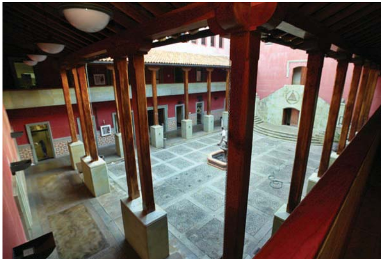
Detalle de las columnas interiores del edificio de la Cancillería de la República vistas desde el segundo piso.