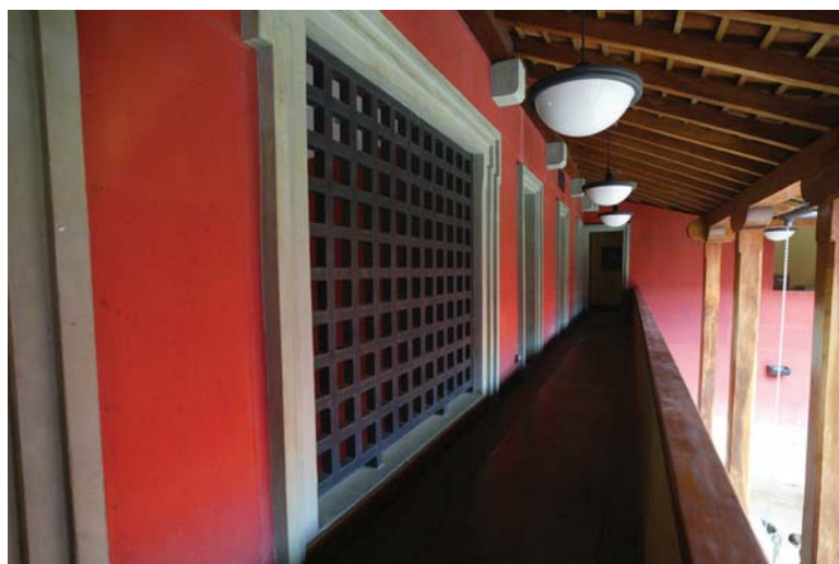
Detalle en perspectiva de la segunda planta del edificio de la Cancillería de la República.