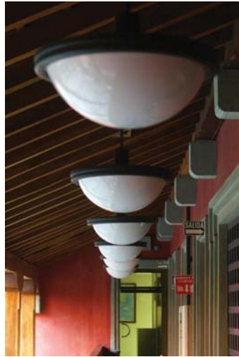
Detalle del techo del segundo piso de la Cancillería de la República.