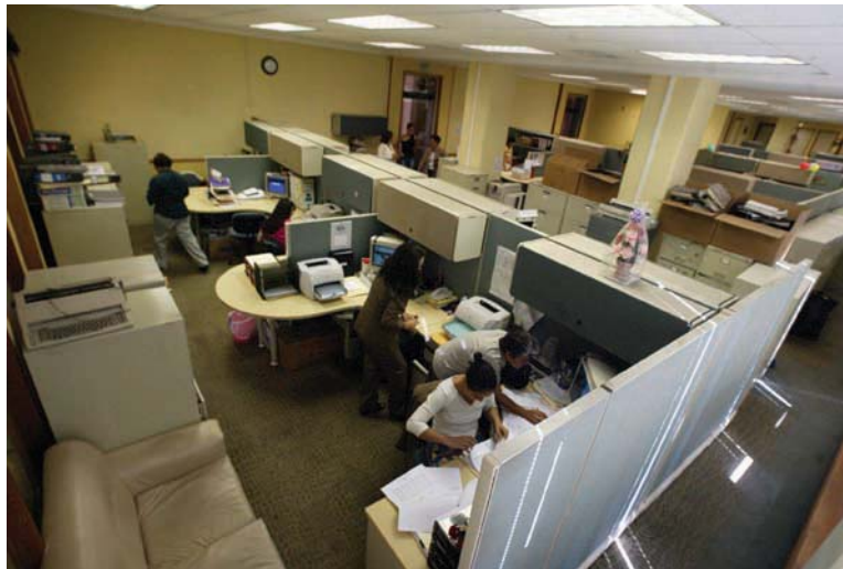
Ambiente laboral de las oficinas del Ministerio de Relaciones Exteriores.