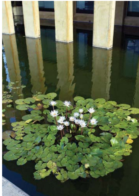
Detalle del estanque que rodea el edificio externo del Minrex con nenúfares de la rica flora nicaragüense y vistosos peces de colores que cautivan la mirada de los visitantes.