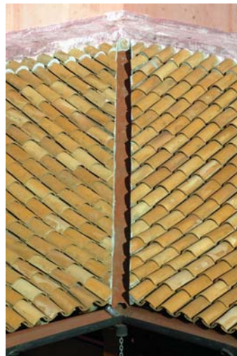
Detalle del entejado del alero que circunda el patio interior del edificio de la Cancillería de la República.